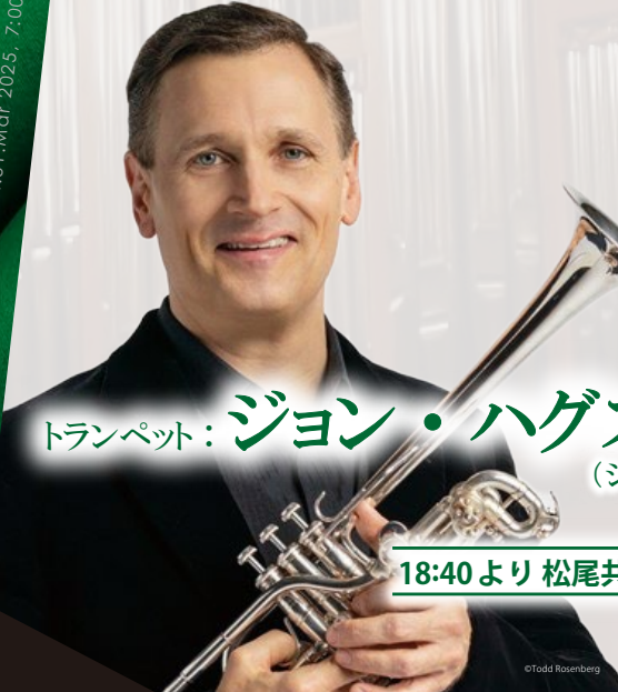
トランペット：ジョン・ハグストロム (シカゴ交響楽団)

※公演の内容は諸般の事情により変更になる場合がございます。あらかじめご了承ください。