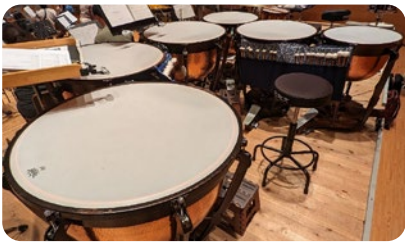
使用楽器：ティンパニ Pearl(パール)88H ※組曲「惑星」仕様の配置